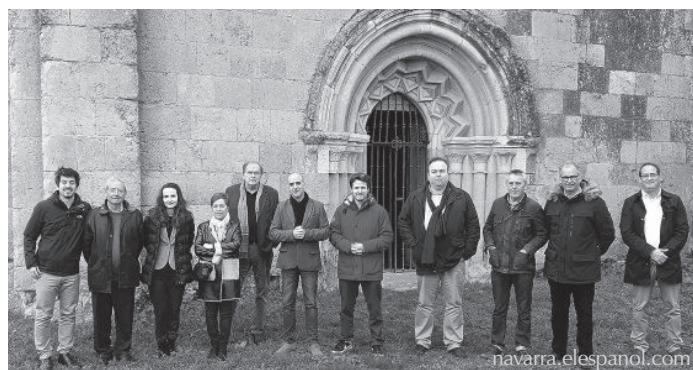
El jurado del Premio 2018 posa delante del Monasterio de Sandoval.

Dos periodistas navarros, uno de ellos miembro de nuestra asociación, han sido galardonados en la tercera edición de los premios Sandoval que concede el Ayuntamiento de Mansilla Mayor para reconocer a los profesionales que contribuyen de manera extraordinaria al enriquecimiento del Patrimonio Arquitectónico y Cultural del Camino de Santiago.