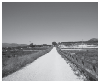
CAMINO VIA VERDE