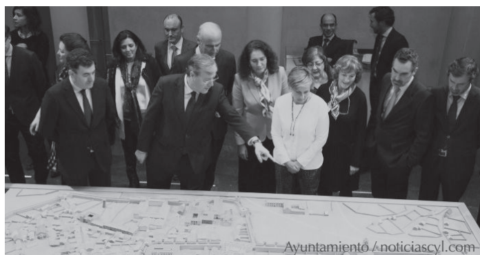
Reunión del pleno del Consejo Jacobeo en León.

El 2021 será un año muy especial para el Camino de Santiago, ya que ese año tendrá lugar el Año Jubilar Compostelano, un tiempo de gracia que ocurre cada vez que el 25 de julio, cuando se conmemora el Martirio del Apóstol Santiago, coincide con domingo.