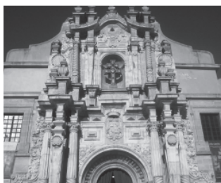
SANTUARIO DE CARAVACA

Transcurre por la vía verde del noroeste, un antiguo trazado del ferrocarril con muchos viaductos que impresionan por su altura, entre campos de secano que dan la impresión de que estás en la Luna por su perfil arenisco y por la erosión. Fue una sorpresa durante esta etapa la cantidad de conejos que salían cruzando el camino y una perdiz que cantaba a mi paso situada sobre una loma. También encontramos castillos imponiéndose en el paisaje. Me quedé a dormir en el Convento de las Clarisas, donde reciben y atienden maravillosamente a los peregrinos.