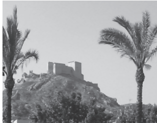
CASTILLO DE MULA

Durante esta etapa el río Segura nos acompaña en toda la marcha como si fuera nuestro guía, entre naranjos y limoneros con un aroma especial. Hay tramos asfaltados para bicicletas, y al llegar a Murcia el camino discurre en un paseo arbolado con las edificaciones al frente.