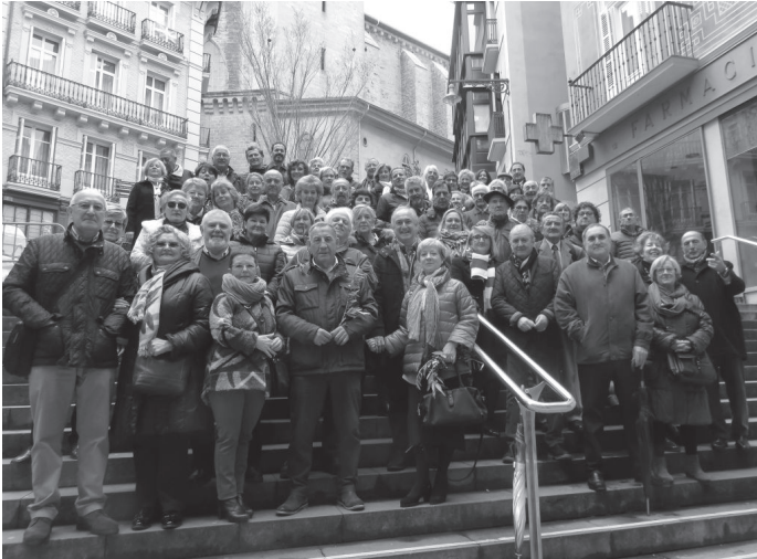
Día de la Asociación 2018, el pasado 25 de marzo.

A punto de finalizar la estación primaveral, quiero recordar algunas de las actividades que gracias a vuestra participación hemos desarrollado durante este periodo.