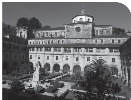
Monasterio de Samos, Lugo.