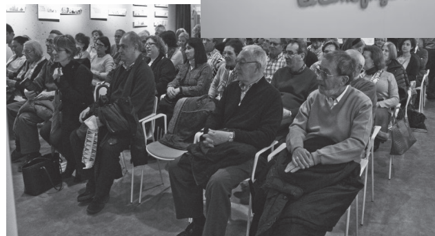
Algunos de los asistentes al acto.