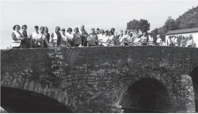
Foto de grupo de los asistentes.

arqueológico de Las Médulas, declaradas Patrimonio de la Humanidad; otra, atraviesa gran parte de la Ribeira Sacra, por el Sur lucense, salpicada del mayor número de iglesias románicas gallegas, enclavadas, en su mayor parte, en los impresionantes cañones del río Sil y laderas del río Miño.