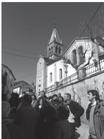
Recorrido cultural por Sarria.

Durante los días 12 y 13 del pasado mes de marzo tuvo lugar en Sarria y Monasterio de Samos una reunión de la Fraternidad Internacional del Camino de Santiago (FICS), a la que acudió invitada nuestra Asociación, para debatir abiertamente sobre varias cuestiones que afectan en este momento al Camino de Santiago y elaborar propuestas de posible mejora.