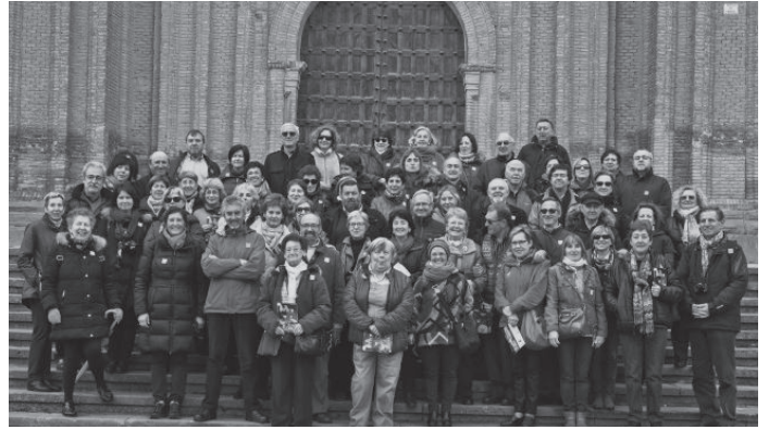
Los asistentes posando frente a la Colegiata de San Miguel.